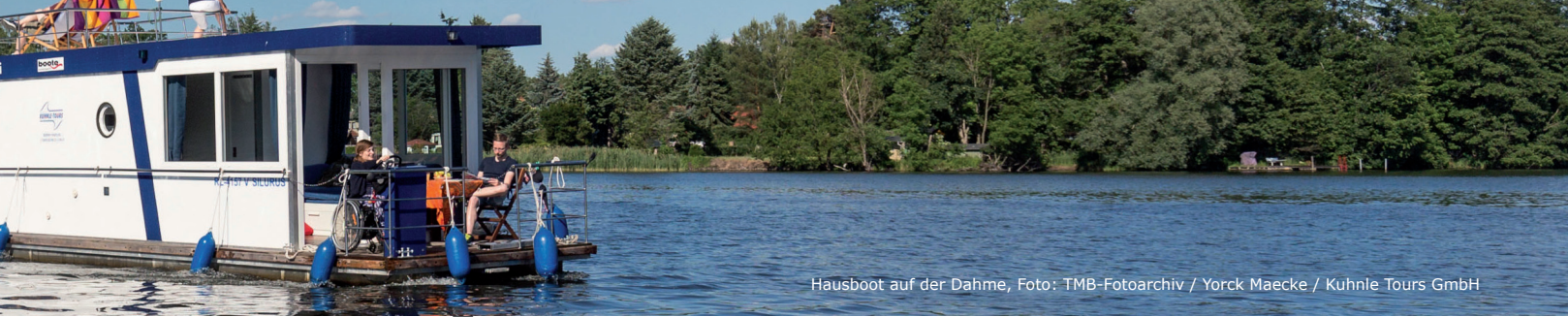
Hausboot auf der Dahme